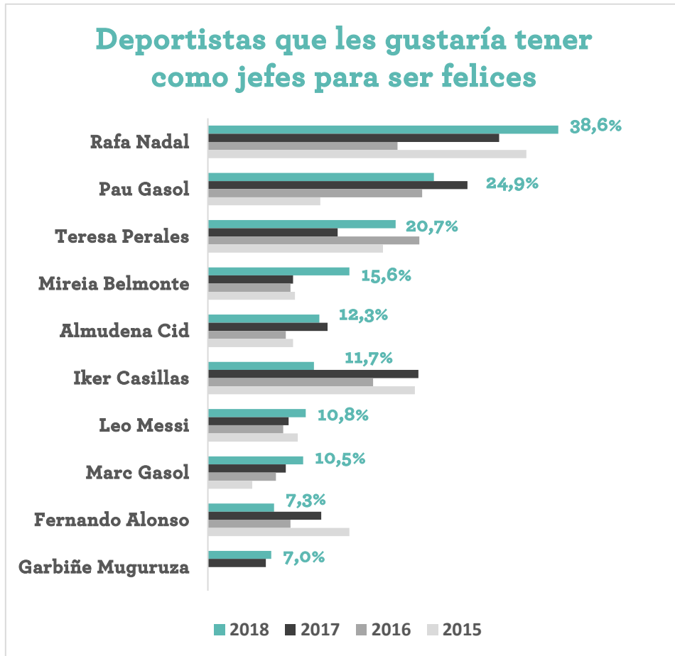
IV Encuesta Adecco sobre Mejores jefes y Empresas más felices para trabajar. Aragón

Marc Gasol es otro de los jugadores españoles de la NBA que sería un buen jefe para los aragoneses. El pequeño de los Gasol mejora 1,9 puntos porcentuales y se coloca octavo del ranking con un 10,5% de los votos. Le sigue el piloto asturiano Fernando Alonso (7,3%, -5,2 p.p.) que pierde una plaza y cierra el ranking la tenista ganadora de un Roland Garros y del último Campeonato de Wimbledon, Garbiñe Muguruza (7%) que se cuela este año en el top 10 . 3