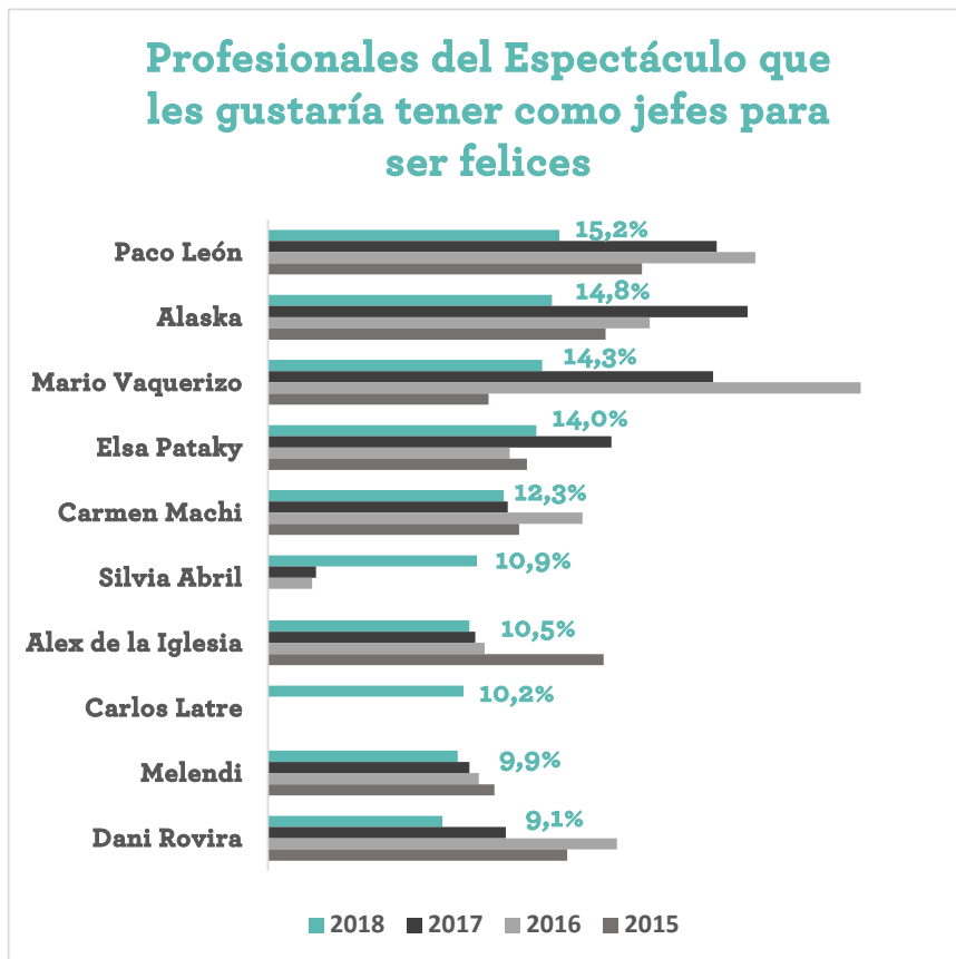
IV Encuesta Adecco sobre Mejores jefes y Empresas más felices para trabajar. Aragón

Pocas novedades se registran en la tercera plaza la cual sigue estando ocupada por el cantante Mario Vaquerizo (14,3%). Tras él se coloca cuarta la actriz Elsa Pataky (14%) que sube una posición.