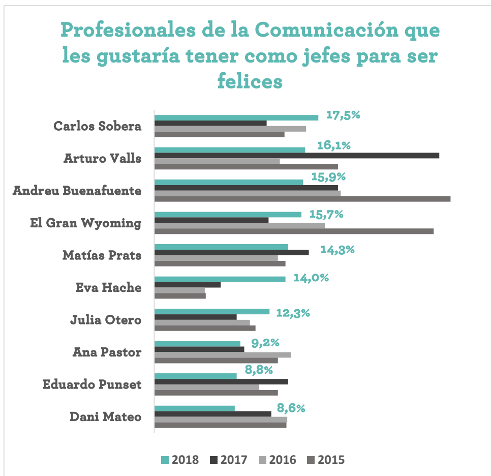
IV Encuesta Adecco sobre Mejores jefes y Empresas más felices para trabajar. Aragón

Quinto sigue el periodista Matías Prats , con un 14,3% de los votos, quien precede a la humorista Eva Hache , que aparece por primera vez entre los diez más votados en sexta posición, las periodistas Julia Otero y Ana Pastor (primera vez en el top 10 para la primera, la segunda regresa tras un año ausente) y el divulgador Eduard Punset (baja un puesto). Cierra el ranking por segundo año consecutivo el colaborador televisivo Dani Mateo 6 .